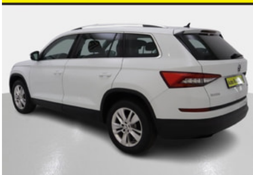
Auto Richner AG